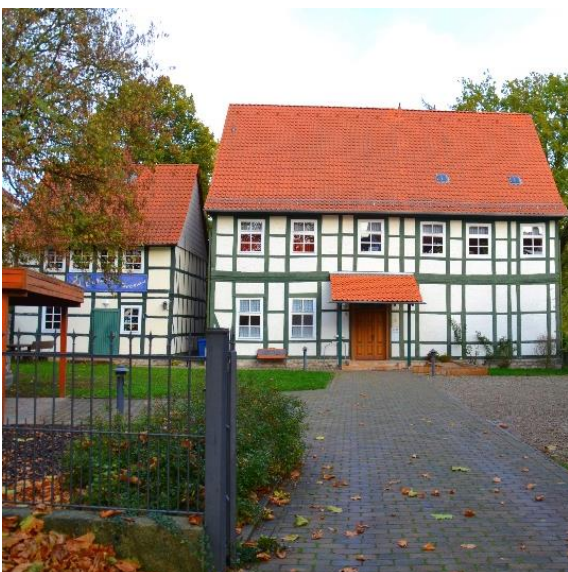
Pfarrgrundstück mit dem Pfarrhaus (rechts) inkl. Gemeindsaal und dem Jugendhaus (links)

Die Stadt bietet ein familienfreundliches Umfeld (Krippen, Kindergärten, Grundschule, Kooperative Gesamtschule mit Gymnasialzweig) sowie eine funktionierende Infrastruktur mit div. Einkaufsmöglichkeiten, Wochenmarkt, Ärzten, Apotheken und einem Krankenhaus.