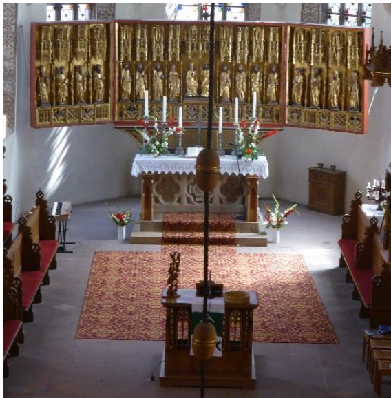
Altarraum in der St. Matthäikirche

In der St. Matthäi Kirchengemeinde Gronau, Ev.-luth. Kirchenkreis Hildesheimer Land - Alfeld, ist die volle Pfarrstelle ab 1. Juni 2023 durch Ernennung neu zu besetzen. Unser Pastorenehepaar geht in den Ruhestand.