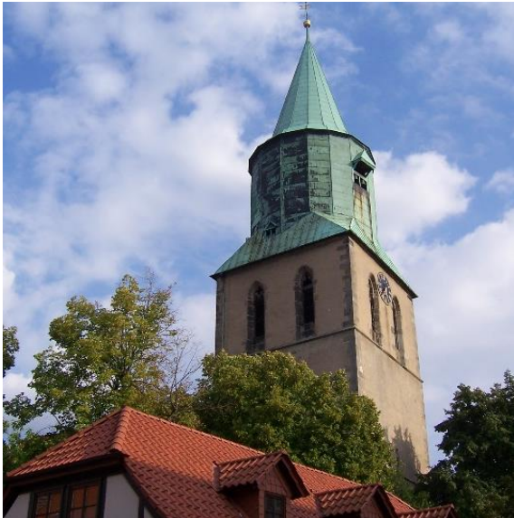
Kirchturm der St. Matthäikirche